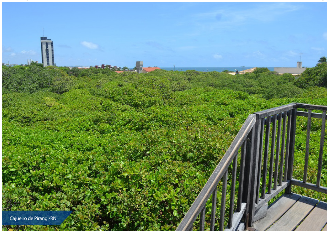
Cajueiro de Pirangi/RN

Os minicursos são voltados para qualquer pessoa que tenha um quintal em casa e serão realizados no Cajueiro de Pirangi, com exceção da aula de poda que acontecerá em um hotel próximo ao cajueiro. As informações para inscrição podem ser obtidas na recepção do maior cajueiro do mundo ou pelo telefone: (84) 9.8899-1978.