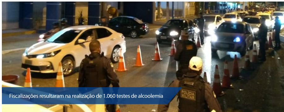
Fiscalizações resultaram na realização de 1.060 testes de alcoolemia

No caso da Lei Seca, o motorista flagrado dirigindo embriagado é punido com retenção da CNH, apreensão do veículo, que só