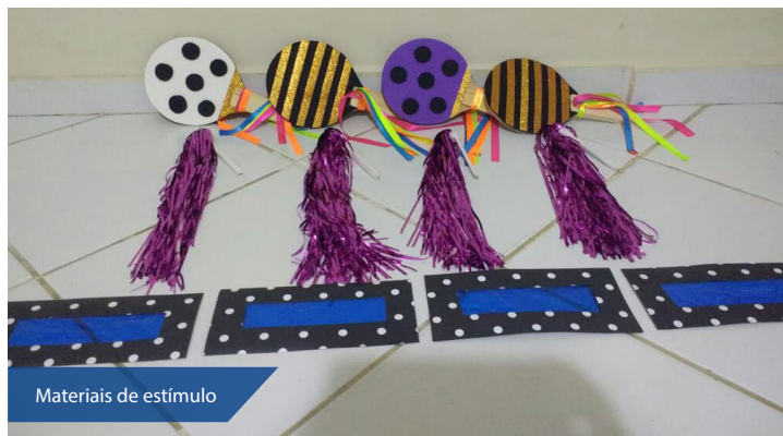
Materiais de estímulo