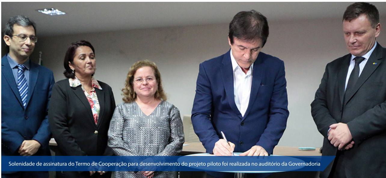
Solenidade de assinatura do Termo de Cooperação para desenvolvimento do projeto piloto foi realizada no auditório da Governadoria

Implantação do novo sistema de digitalização para a emissão do RG teve investimento de R$ 10 milhões e oferecerá emissão do documento de forma simples, ágil e segura, sem fraudes